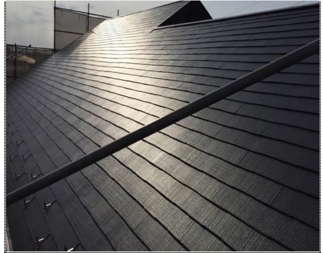
屋根 塗装工事 完了